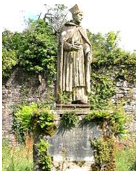
Raymond le Gros

úsáideadh an t-ainm in Éirinn, i roinnt leaganacha, ag teacht ón Sean-Bhéarla/Angla-Shacsanais agus ón Normannais/Frainncis.