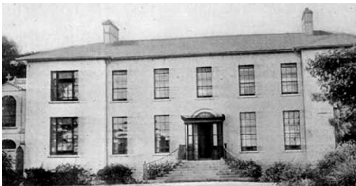
Teach Bhaile an Treoraigh- Ballytrent House