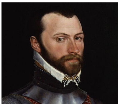
Richard Bingham, Gobharnóir Sasanach ar Chonnacht

Rug Bingham ar Gráinne, sa bhliain 1586, agus bheartaigh sé í a chrochadh, agus í 56 bliana d’aois. Mar sin féin, tharraing sé siar uaidh seo. Ach thóg sé a cuid eallach, a cuid talún agus a cuid longa uaidh, gur fágadh beo bocht í.